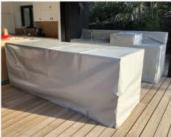
Housse pour restaurant