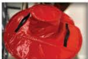
Housse pour l'aéronautique