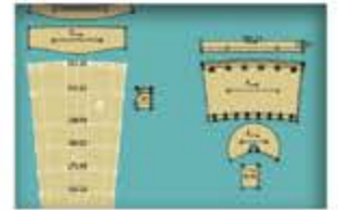
Logiciel de traçage