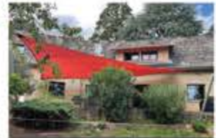
Voile d'ombrage chez un particulier