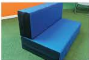
Housse pour canapé