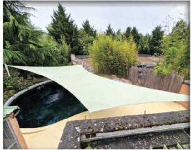
Parc d'attraction : Le Pal