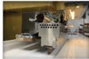
Machine à souder