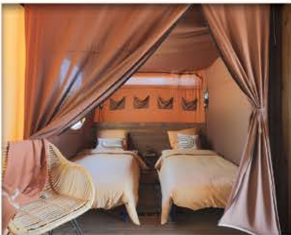
Hekipia Tiny House