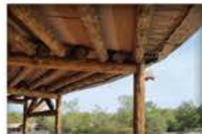
Parc d'attraction : Le Pal